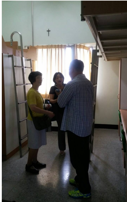
▲ 訪團參觀學校宿舍。 The delegation visited the dormitory.