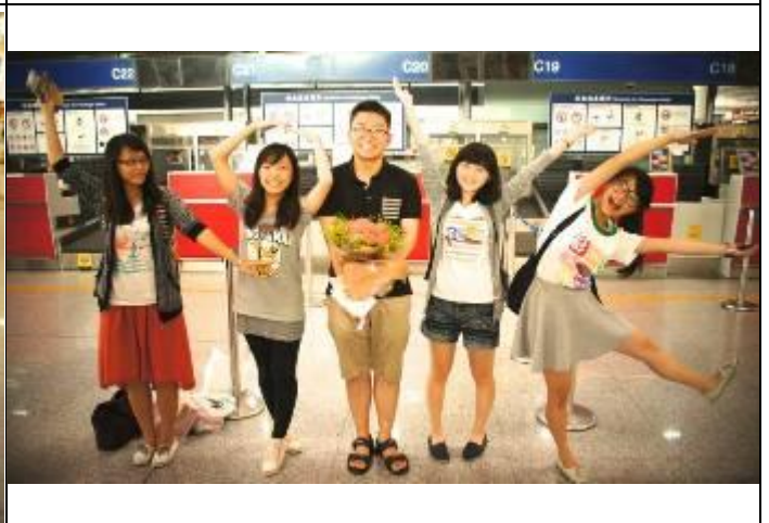
文藻學生開心與中國人大學生合照。