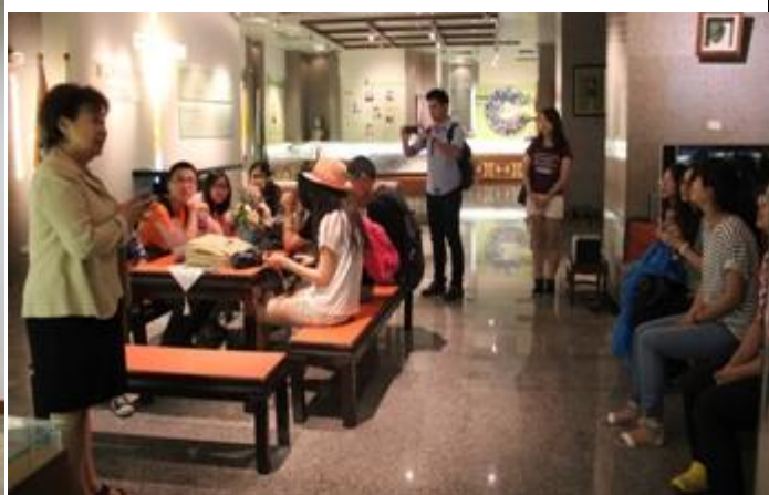
易守箴館長(左立者)解說校史館。