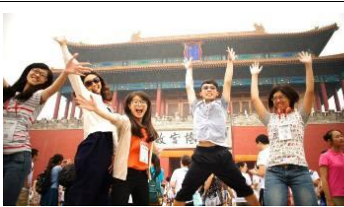
文藻團員開心遊北京故宮。