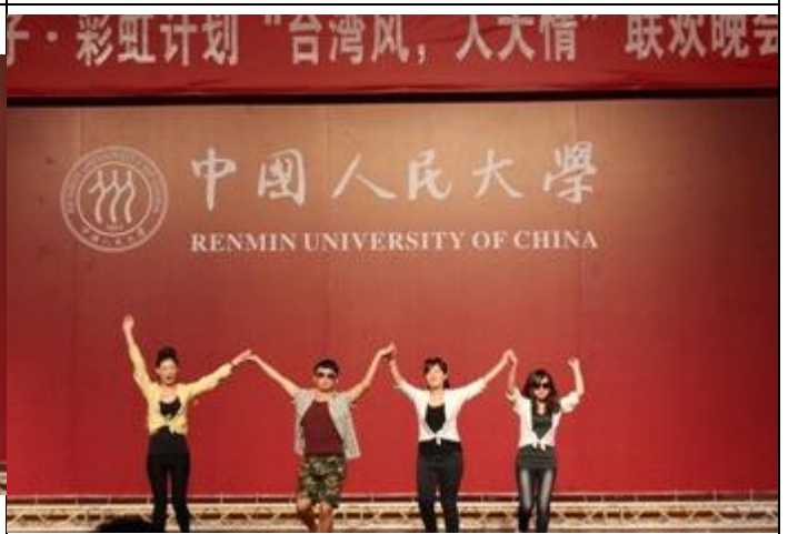
文藻人表演台客舞，介紹正港台式文化。