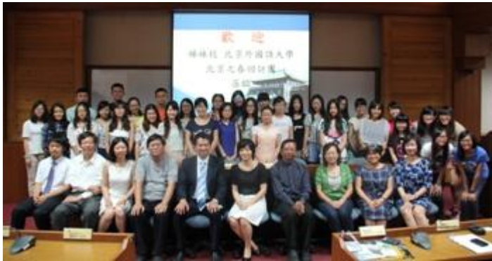
全體大合照。