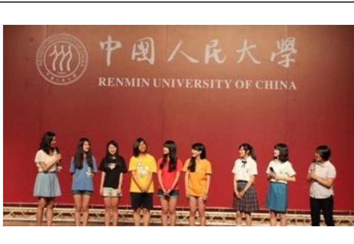
文藻學生穿上系服及高低年級制服介紹文藻。