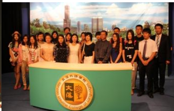
訪賓於攝影棚合影。