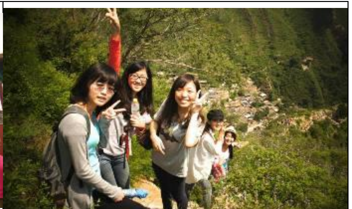
文藻團員走訪北京名景「爨底下」。