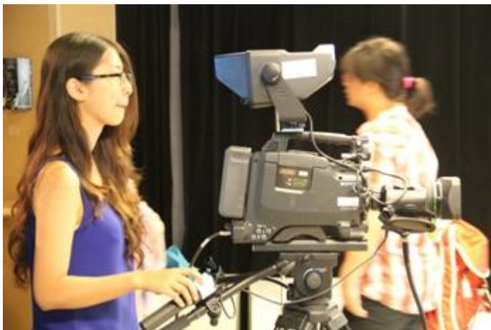
北外大學生操作攝影機。