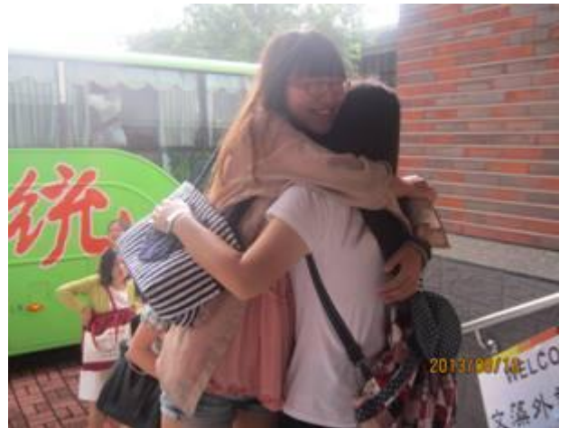
北外大學生見到久違的台灣朋友，激動相擁。