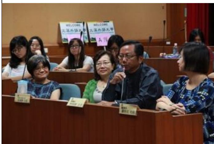
文藻行政主管及教師出席座談會。